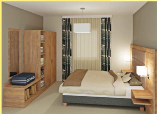
Ein Gästezimmer zum Wohlfühlen inklusive gemütlicher Sitzzecke.

Das bewährte Alte möchten wir behutsam mit den Standards eines modernen Gästehauses verbinden. Unser Herz schlägt für schöne, moderne Gäste Räume, die zur Begegnung und zum Wohlfühlen einladen. Das geplante Investitionsvolumen beläuft sich auf 1,5 Millionen Euro.